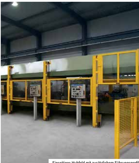
Einseitiges Hubfeld mit zusätzlichem Führungsprofil