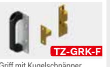
Griff mit Kugelschnäpper