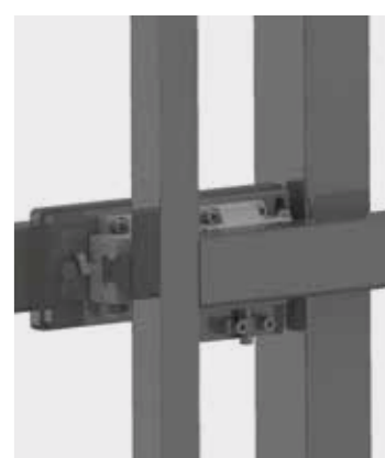
Detail Präzisionsführungseinheit, justierbar