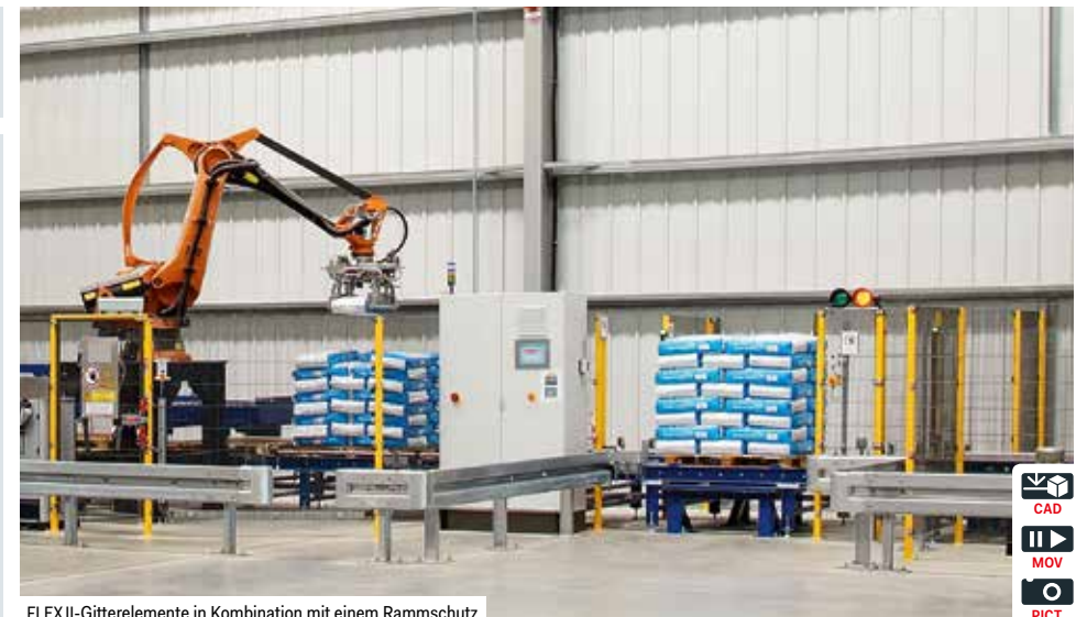
FLEXII-Gitterelemente in Kombination mit einem Rammschutz